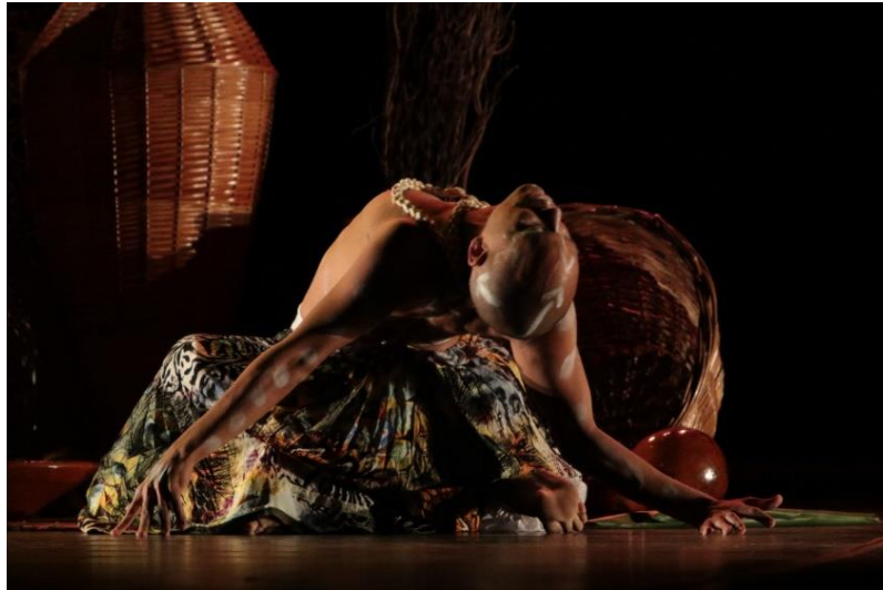
FIGURA 3: Exú 15