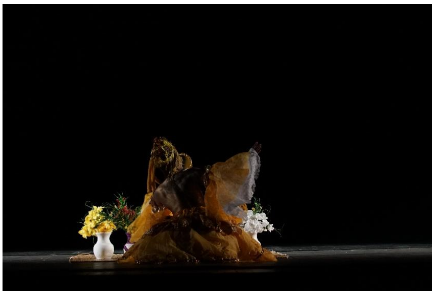
FIGURA 4: Oxum 18